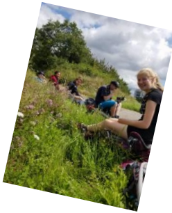
Fahrtenfotos der LaFa